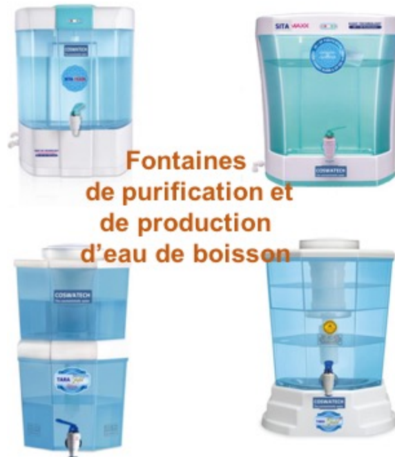
Fontaines de purification et de production d'eau de boisson